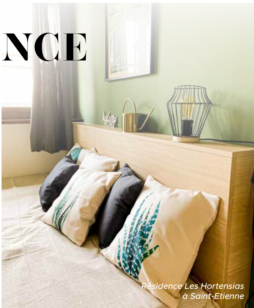
Résidence Les Hortensias à Saint-Etienne

Les intérieurs sont pensés dans les moindres détails pour créer une atmosphère accueillante.