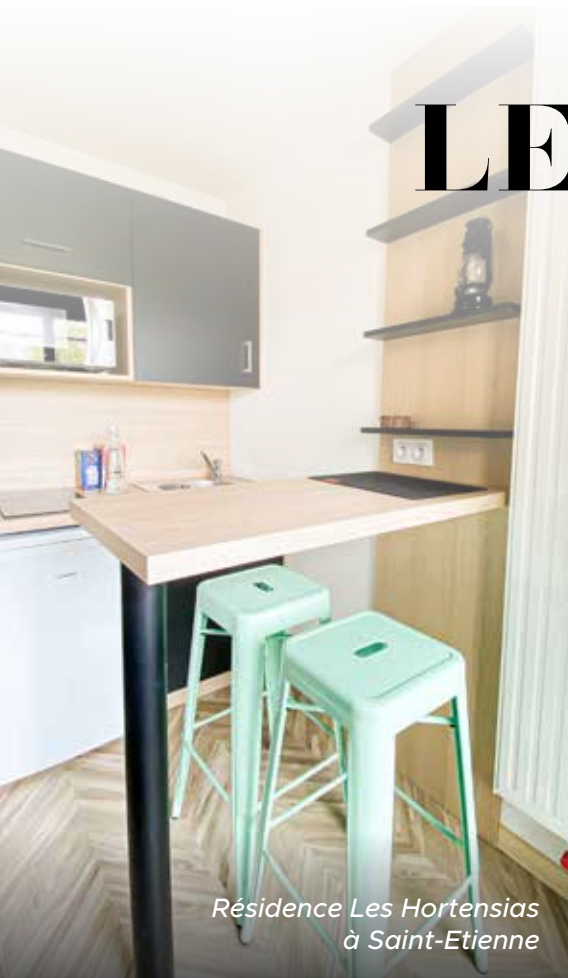
Résidence Les Hortensias à Saint-Etienne